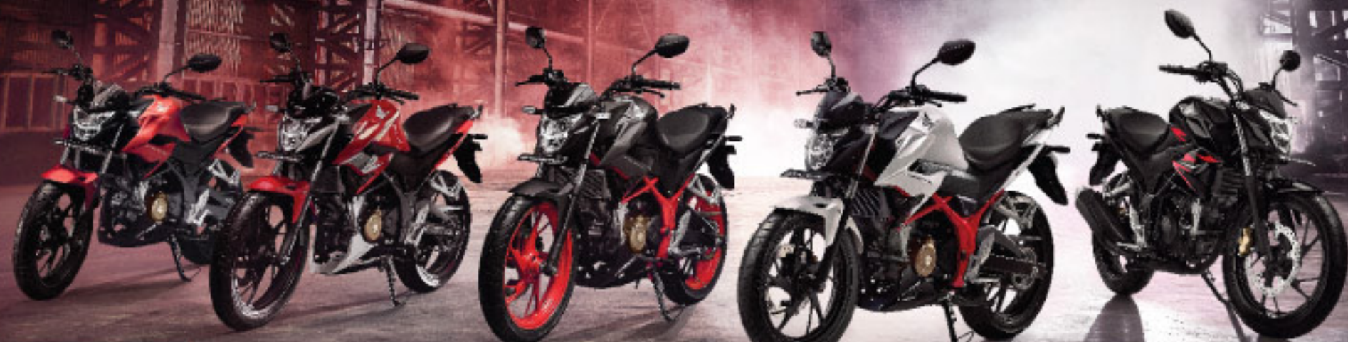
Fury Mat Red SPECIAL EDITION

Spesifikasi dapat berubah sewaktu-waktu tanpa pemberitahuan terlebih dahulu untuk meningkatkan mutu sepeda motor Honda menjadi lebih baik.