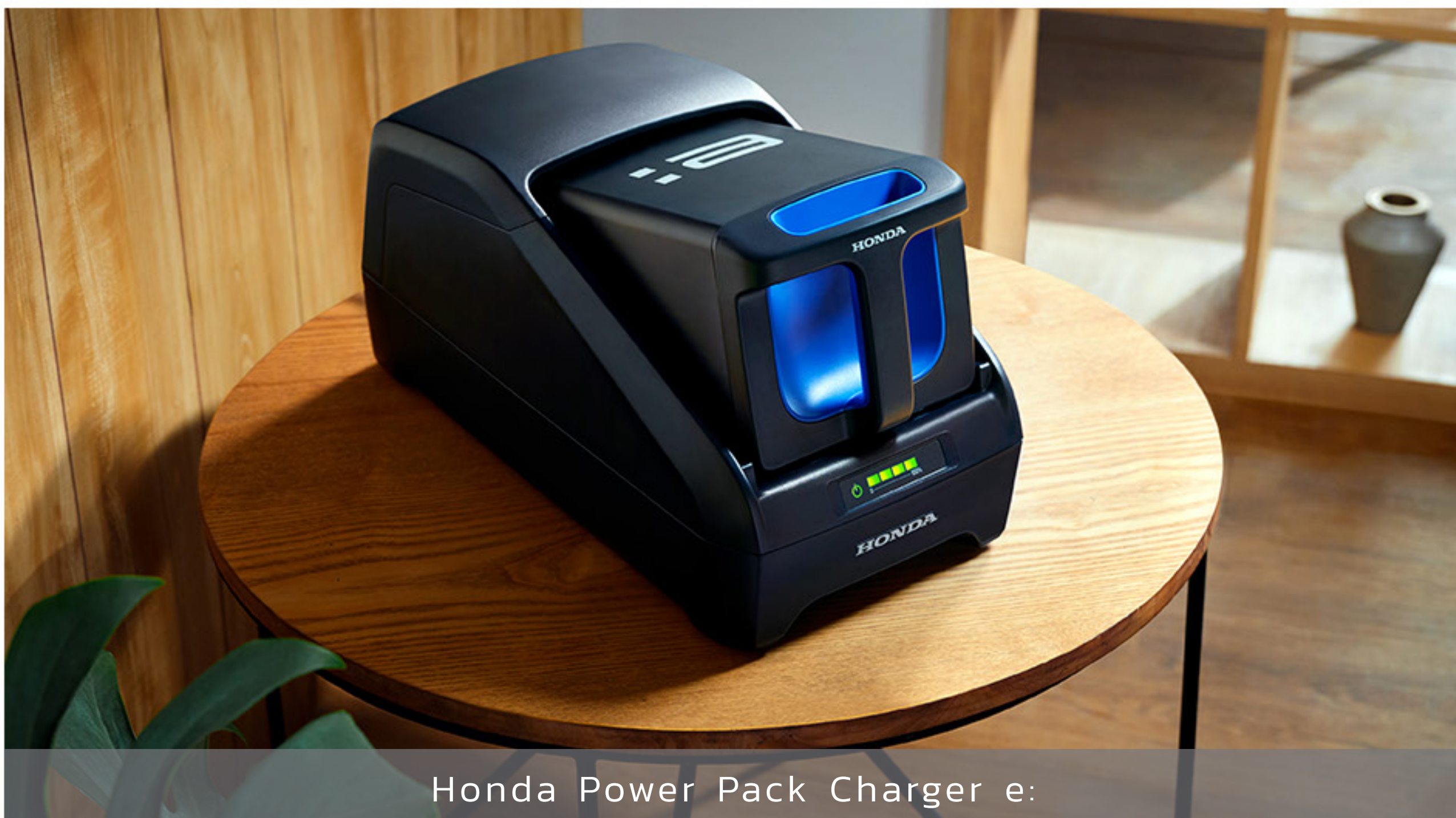
Honda Power Pack Charger e: