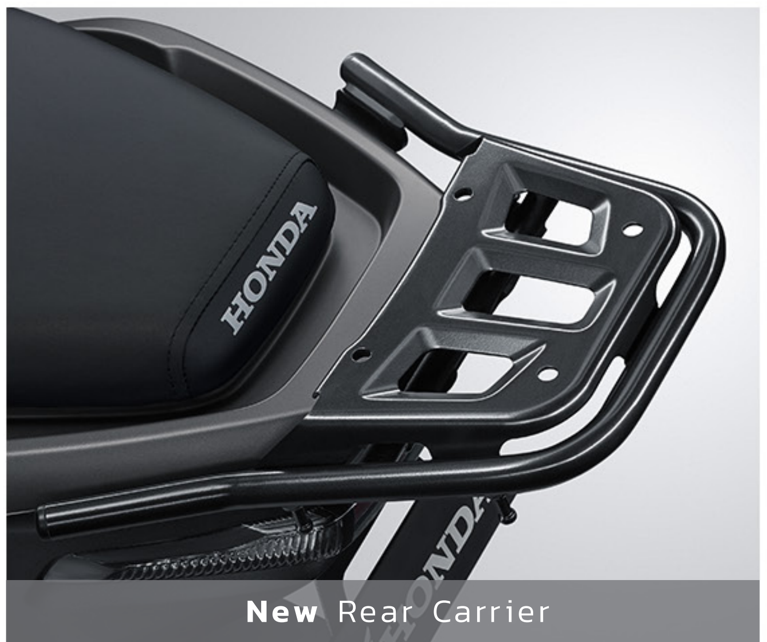
New Rear Carrier

Honda EM1 e: PLUS hadir dengan fitur fungsional rear carrier untuk menunjang segala kebutuhan dan berikan kemudahan dalam beraktivitas sehari-hari.