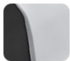
Innovative White (EM 1 e:)