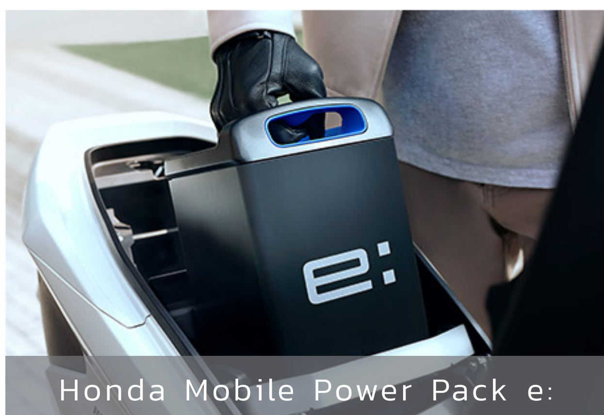
Honda Mobile Power Pack e: