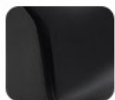
Intelligent Matte Black (EM 1 e:)