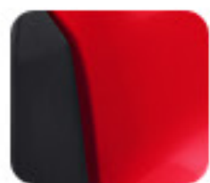
Smart Red (EM 1 e:)